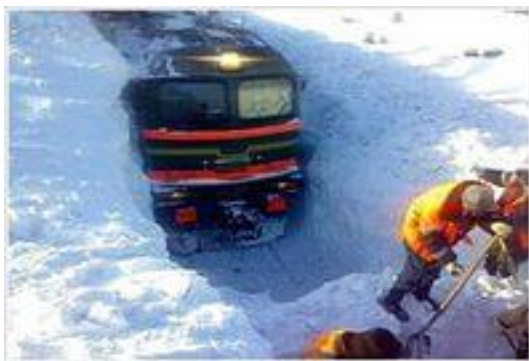
Зависимость от погодных условий.