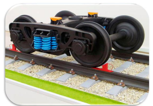
Сложные механические передачи.