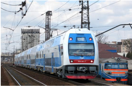
Поезд дальнего следования.