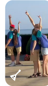
Traditional folk art studios