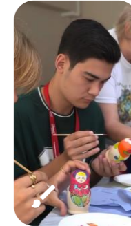
Hands on folk crafts workshops