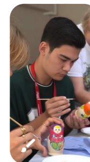
Мастерские народных ремесел