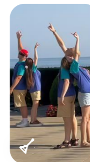
Студии народных творчеств