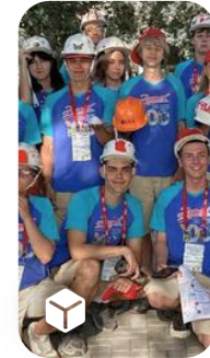
Hands – on tech laboratories